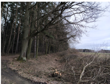
Příprava cesty od Radličky k Novému Dvůru