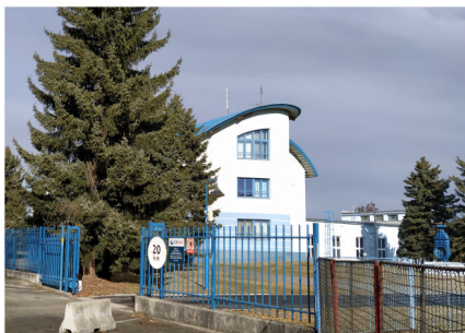
Vodárna v Dolním Bukovsku

V příštím vydání se podíváme na tipy, jak ušetřit vodu nejen v domácnosti.