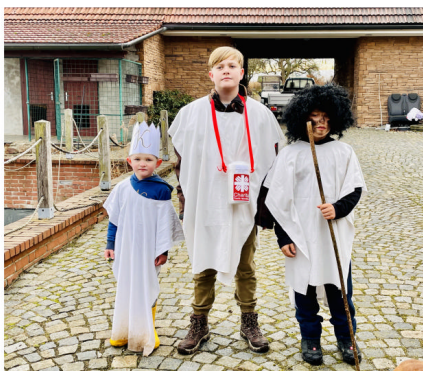
Koledníci z Radonic

Přesto nás nejspíš čekají složitější časy, do Charity přicházejí noví klienti hledající pomoc a na druhé straně ubývají kapacity, jak lidské, tak finanční. Budoucnost však vidíme optimisticky, Charita je nadále připravena pomáhat. Díky Tříkrálové sbírce začneme všichni rok 2022 dobrým skutkem, koledníci zase rozšíří radost