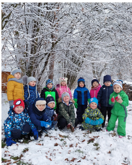
Zimní radovánky u Berušek.