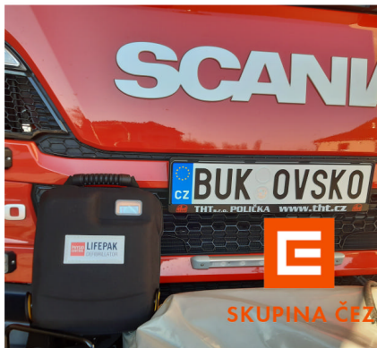
Defibrilátor Lifepak 1000