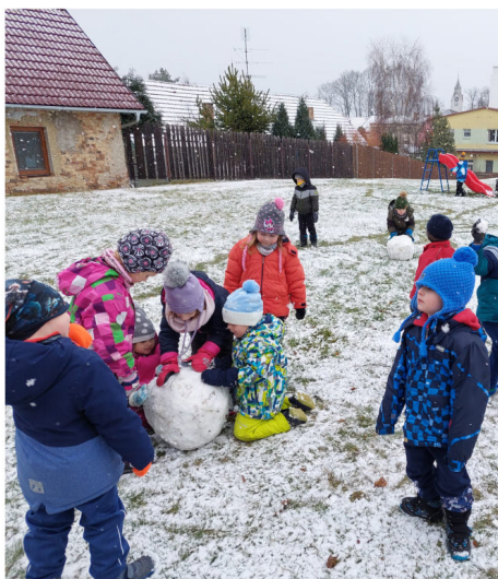
Krtečky staví sněhuláka na školní zahradě.