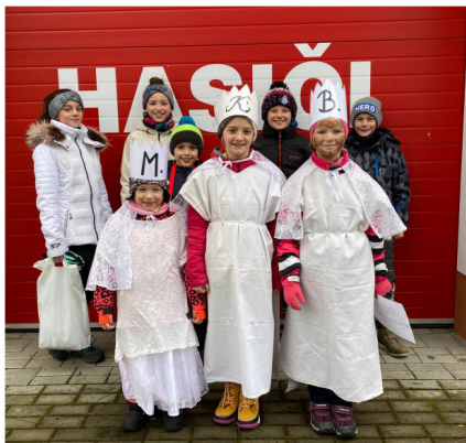
Koledníci v Pelejevovicích

15 % sbírky je určeno na velké diecézní projekty, 10 % putuje do krizového fondu, odkud jsou uvolněny při