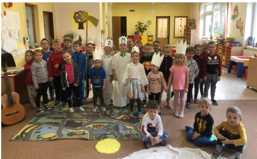
Oslava svátku Tří králů v mateřské školce.