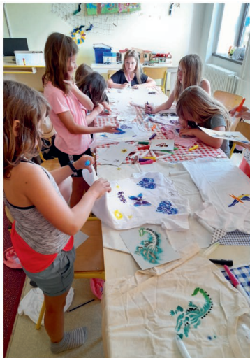
Děti z příměstského tábora při výrobě triček.